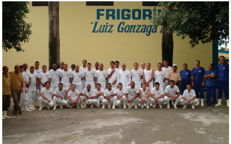
Quadro de colaboradores do Frigorífico de Cachoeiro de Itapemirim.

Além do atendimento à demanda de Cachoeiro, a prestação do serviço de abate de bovinos e suínos está se expandindo para municípios vizinhos, o que nos habilita visualizar a geração de mais empregos, sempre trabalhando para que a